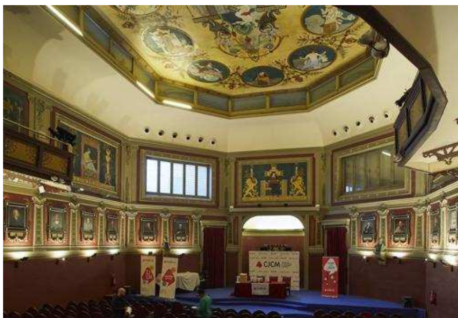
Aspecto actual del salón de actos del Ateneo - Guillermo Navarro

El núcleo duro de los trabajos –financiados por el Ministerio de Fomento con un coste de dos millones de euros– estará terminado, según se prevé, a finales de marzo. De esta forma, el Ateneo –reconocido como Bien de Interés Cultural (BIC) con categoría de monumento– recuperará su idea de museo romántico y volverá a sacar a la luz sus grandes lucernarios del siglo XIX que se taparon durante unas obras en la pasada década de los setenta, así como la pintura de los techos de la Cacharrería –antiguo lugar de tertulias donde, según la leyenda, se tiraban cacharros a la cabeza cuando los debates se acaloraban– y los icónicos accesos a la cantina.